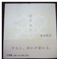
「求めない」加島祥造 著

僕はこの本を即座に¥1,300で購入しました。 著者の加島先生は英文学の権威で、今は信州の伊那谷の山里で、家族と離れひっそりと 暮らしています。「老子」に出会い、たぶん 求めないことを発見されたのだと思います。 信州の伊那谷は日本の千円と呼ばれています。生きていくこと、生きることの ほんとうの原風景がそこにはあるみたいです。 僕も近い将来そこに落ち着きたいと思います。 これは……求めてる……？ アカン！